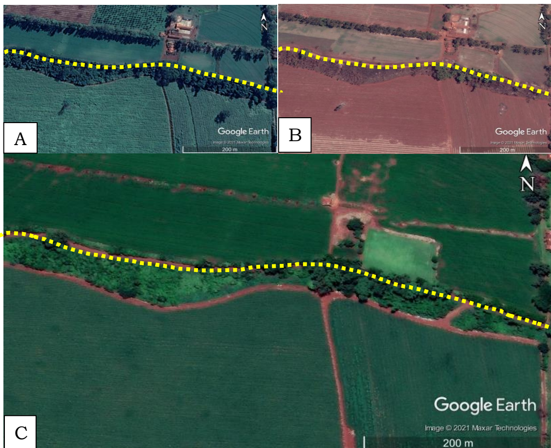
Figura 2. Imagens da vegetação adjacente à SCP-242 em 2013 (A), 2014 (B) e 2020 (C), as linhas tracejadas amarelas indicam a área de estudo.

do interior da propriedade contínua à vegetação da margem da estrada analisada por esses autores. Segundo Costa et al. (2019), tal situação aumenta a ação do vento, luminosidade, redução de umidade no solo, importantes fatores que ocasionam a mortalidade de espécies arbóreas, além da compactação do solo pelo trânsito de veículos e os incêndios.